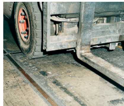
PCI Elritan 140 für Bodenfugen in Industrie- und Lagerhallen.