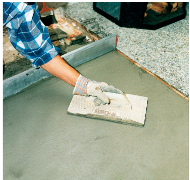
... mit einem Reibebrett verdichten und zureiben.