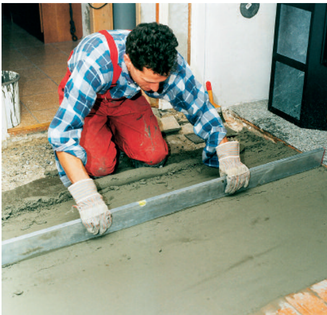
PCI Repament auf den vorbereiteten Untergrund in der gewünschten Schichtdicke einbringen und abziehen ...

5 Frisch eingebrachtes PCI Repament nur bei Außenanwendung und starker Wind- oder Sonneneinwirkung über einen Zeitraum von ca. 6 Stunden vor zu schneller Austrocknung schützen.