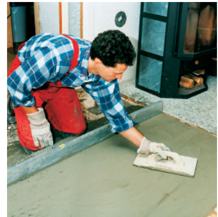
Die Fertigmörtelmischung PCI Repament härtet schwindungsarm und rissfrei aus.