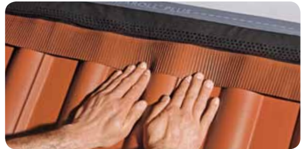
c.) Dank der hohen Dehnbarkeit erleichtert Figaroll Plus ein exaktes und leichtes Anformen, auch bei stark profilierten Dachpfannen.