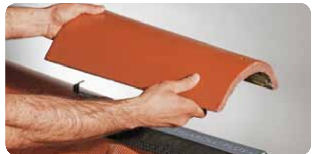
d.) Firststein oder -ziegel mit Firstklammer auf der Firstlatte befestigen.