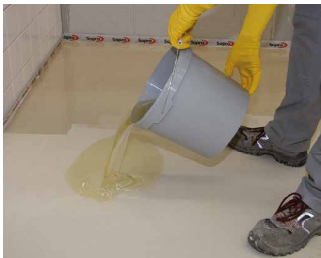
7 Sopro Epoxi-Grundierung auf den Untergrund ausgießen ...