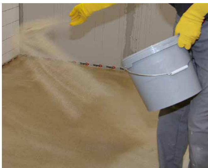
9 ... und je nach nachfolgendem Auftrag mit Sopro Quarzsand fein 0,1–0,3 mm oder Sopro Quarzsand grob 0,4–0,8 mm im Überschuss absanden.