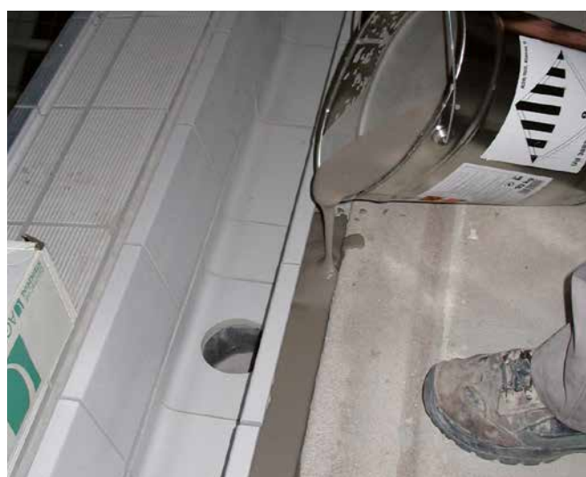
Zur Herstellung einer kapillarbrechenden Fuge im Schwimmbadbau wird Sopro Epoxi-Grundierung mit Sopro Quarzsand grob 0,4–0,8 mm und Sopro Kristallquarzsand in Raumteilen 1 : 1,5 : 1,5).