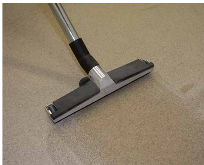
10 Überschüssigen Quarzsand nach vollständiger Trocknung der Sopro Epoxi-Grundierung (nach ca. 24 Stunden) mit einem Industriestaubsauger oder einem Besen aufnehmen.