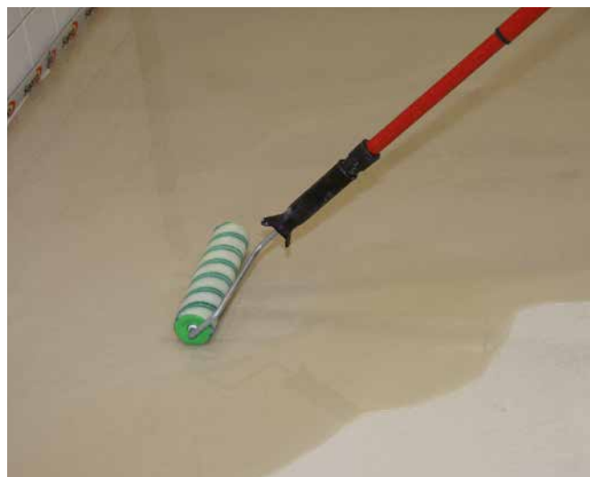
8 ... mit einer harzbeständigen Rolle (z.B. Sopro KurzflorRolle) satt aufrollen ...