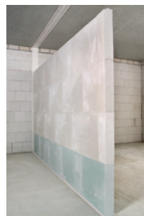
Randanschlussstreifen werden direkt nach dem Wandaufbau bzw. nach einer geforderten ganzflächigen Verspachtelung flächenbündig gekürzt.