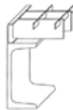
U-Schienen-Konstruktion als Gitterrostaufleger