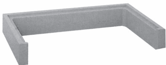
Aufsatzrahmen 3-seitig (Standard-Ausführung) passend für Lichtschächte „D“ und „AS“